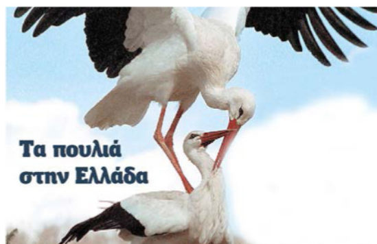
Τα πουλιά στην Ελλάδα

Στα πρόσφατα χρόνια, ο νησιωτικός χώρος του Αιγαίου υφίσταται νέες δημογραφικές, κοινωνικές και οικολογικές μεταβολές. Η διαβίωση στα νησιά ήταν πάντα συνώνυμη της λιτότητας και τα ανταλλάγματα μιας εξαιρετικά κοπιαστικής ζωής φαντάζονταν μινωικά στις σημερινές νησιωτικές κοινωνίες. Οι νησιώτες, που πάντα χαρακτηρίζονταν από έντονη κινητικότητα ως ναυτικοί, εξερευνητές και μερικές φορές πρόσφυγες, οδηγήθηκαν στη δεκαετία του '50 σε εξωτερική μετανάστευση και στη συνέχεια σε αστικοποίηση.